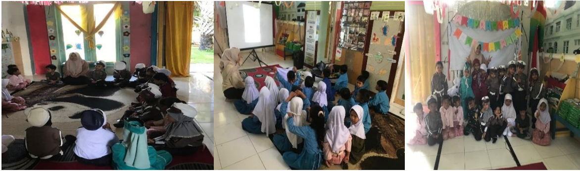
Gambar 1. Anak-anak Kelompok B TK Al-Kawanad Kota Banda Aceh sedang Mengikuti Pembelajaran Menggunakan Media Audio Visual